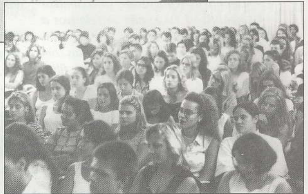
Público lotou o auditório