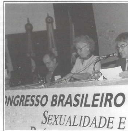
Mesa-redonda Sexualidade e Estru