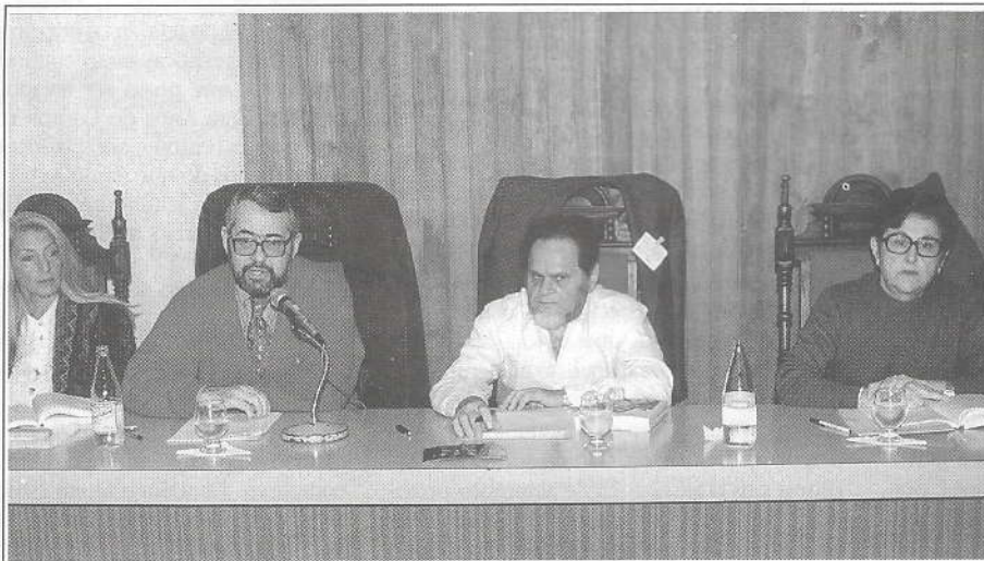
Mesa-redonda sobre Ensino e Aprendizagem