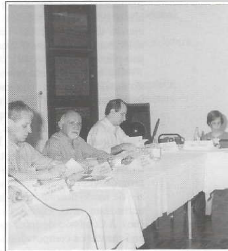
Reunião dos delegados das sociedades

O tema sexualidade Congresso Brasileiro atualização e promoção específico