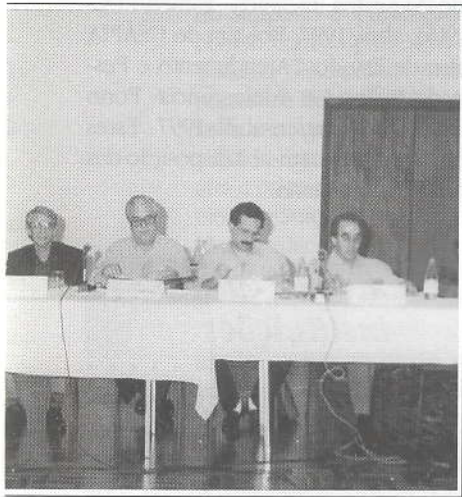
...es componentes da ABP

...e, abordado no XVI de Psicanálise, leva à e o debate de assuntos s da área