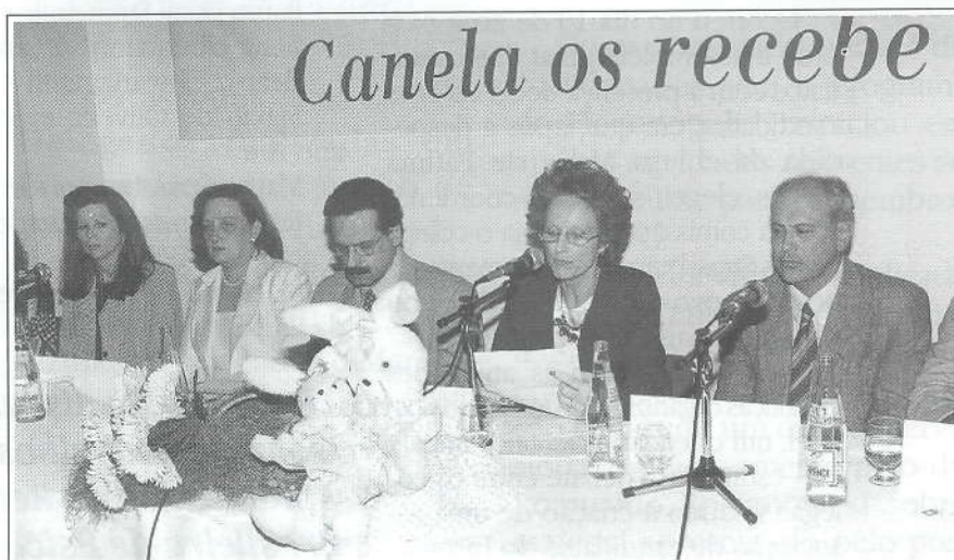
Solenidade de abertura do Simpósio

O programa científico foi elaborado visando proporcionar ao profissional um contato direto com as idéias e o trabalho de convidados. Além das mesas redondas e supervisões coletivas, foram oferecidos